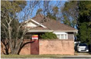
HBMA office and minister's residence moved to 732 Pacific Hwy Gordon (30/7/17).

It was another successful and busy year with many activities and observances throughout the year.