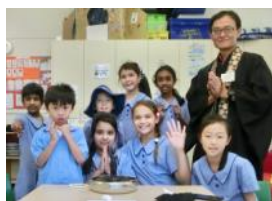
西ゴードン小学校でのスク リプチャークラスの様子。

学校関係、病院、または個人の依頼により、いろいろな場所へ要請に応じて行き交流を持つよう努めています。各地域の合同教会で行われる、「国連世界平和の日」に関連した、平和の集いへの招待があるなど、地域との交流も図っています。2008年より子供たちの通う東Lindfield小学校で仏教スク립チャー(聖典講読)クラスの先生としてボランティアで仏教を担当していましたが、引っ越しがあり、子供達も皆卒業し昨年10周年を迎えたのを期に、仏教連盟を通じ、今年から新しく西ゴードン小学校にて教えることとな