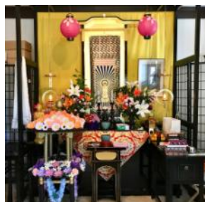
2018 Hana Matsuri Service