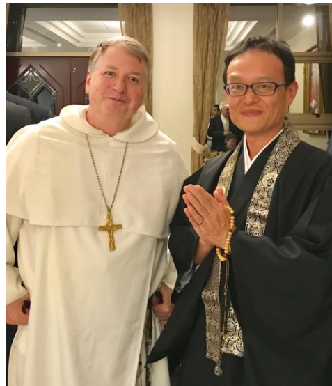
臺州カトリックの長 アンソニー・フィッシャー大司教と

昨年は改修工事のためノースシドニーのメアリー・マクロップ・プレイスにて行われましたが、今年は再び聖メアリー大聖堂のカテドラルハウスにてフィッシャー大司教主催によるイフター晩餐会が5月30日に開催され今回も招待を受けて他の宗教代表者らの皆様と一緒に参加させて頂いて参りました。