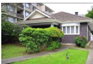
ゴードンの新開教事務所

この一年間であった大きな出来事の一つは、開教事務所の移転でした。昨年7月に突然以前の借家を明け渡すこととなりましたが、幸いすぐに現在のゴードンの物件を見つめることが出来ました。駅からも近く、参