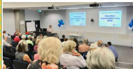
ボランティア表彰式の様子(24/05/18)

5月最後の週は、ボランティア・ウィークにあたり、毎年、この時期にロイヤルノーシヨア病院ではボランティアしてくれている人に、病院から感謝の気持ちを表わす日として、「ボランティア感謝の日」が設けられている。今年は5月24日にその式典が行われ、今年も参列して参りました。最長で52年間ボランティアをしている方が表彰されました！