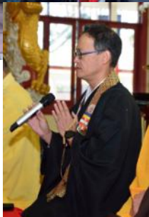
日本を代表して読経

5月27日、シドニー西部ウィザリルパークに位置するベトナム系のフォクフェ寺院より、今年も招待を受け、ウェサク祭の法要に参列させて頂き、招待された中国、韓国系僧侶らとともに日本を代表して読経を納めさせて頂きました。合掌