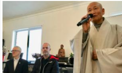
参加者を歓迎する韓国寺住職