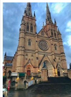
聖メアリー大聖堂

育むことを目的としたラマダン(断食)を約一ヶ月間行う際に、日中は一切の飲食を断ちます。そして、日が沈むと家族や友人が集まって一日の断食の終わった後、夕食を取りますが、その食事をイフターと言っています。このイスラム教の行事をカトリックの大司教が執り行なうことで、シドニーでは異なった宗教間での対