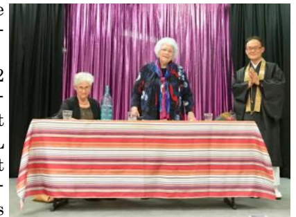
Spirituality in the Pub (2/5/2018)

On Wednesday 2 May 2018, I was invited to talk about my belief at the RSL Paddington, just near the City central. This session is called "Spirituality in the Pub (2/5/2018)".