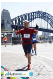
シドニーマラソンに参加(17/9/17)

拝者にとってわかりやすい場所ということで、新しくお参りされる方が増えたことは大変ありがたいことでした。そして、今ひとつ大きな出来事は、世界平和と「シドニー本願寺」建立を祈念し、シドニーマラソンに参加し、無事に完走できたことでした。その際、寄付していただいた皆様には深く御礼申し上げます。