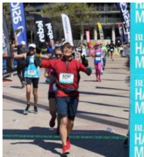
I run full marathon at the Sydney Running festival.

Besides these events, we were able to observe the regular services as well as outside services at a wider range of Buddhist activities in Sydney and other areas. The following is a list of my activities throughout the year ending May 2018