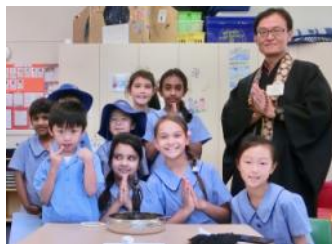
Buddhist scripture class at Gordon West Public School

I have taught Buddhist scripture class every Tuesday morning at Lindfield East Public School (LEPS) for 10 years. However, as my children no longer attend this school and LEPS now is a little too far from Gordon, I decided to change to the Gordon West Public School from this year on behalf of the Buddhist Council of NSW. The brand new class started with 10 students but now I have 17 children from Kindergarten to Year 6. Those children and their parents seem very happy to have an opportunity to learn about Buddhism at their school. Through this volunteer work, I am able to extend my presence within the community, and people in this area have a chance to get to know me as well as HBMA.