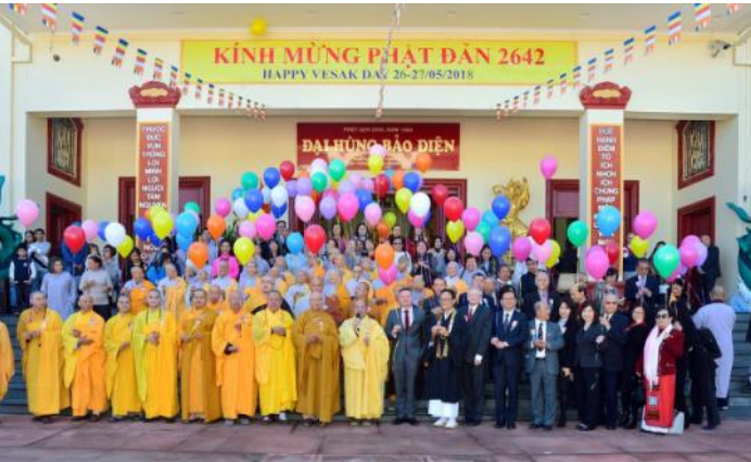
Together we all celebrated Buddha's birth, enlightenment, and entered Nirvana. (27/5/18)