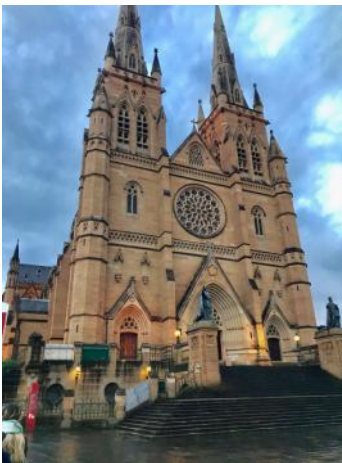
Ifter dinner was held at the St Mary's Cathedral House beside of St Mary's Cathedral (30/05/18).