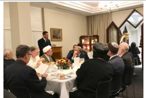
イフターディナーの行われたホール(30/05/18)

育むことを目的としたラマダン(断食)を約一ヶ月間行う際に、日中は一切の飲食を断ちます。そして、日が沈むと家族や友人が集まって一日の断食の終わった後、夕食を取りますが、その食事をイフターと言っています。このイスラム教の行事をカトリックの大司教が執り行なうことで、シドニーでは異なった宗教間での対